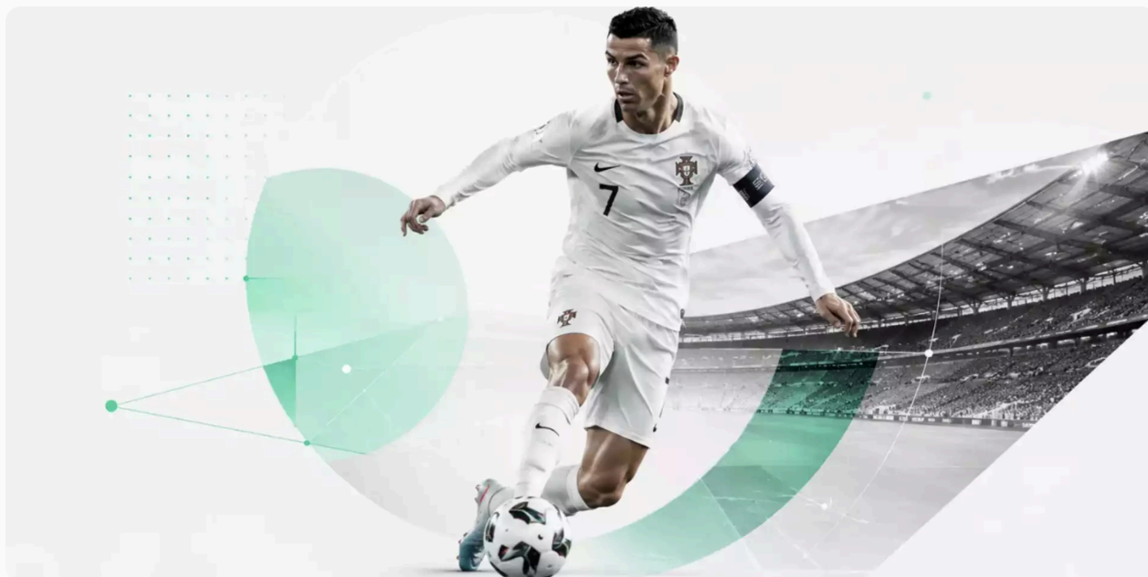
7 empresas portuguesas que estão a mudar o futebol