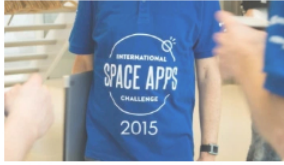
Portugueses no espaço?